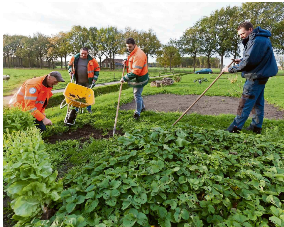
Veel pupillen van Het Kiemhuis maken deel uit van 'groenploegen' en werken buiten.

In Zuidwest-Drenthe staat het bureau inmiddels stevig op de kaart. Jan Meijer kwam er al snel in contact met de Maatschappij van Weldadigheid. „Ik had eerlijk gezegd nog